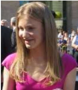
Prinses Elisabeth

07/10/2019/in Aankondiging evenementen /door Erwin van der Linden (PE1CUP)