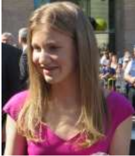
Prinses Elisabeth

07/10/2019/in Aankondiging evenementen /door Erwin van der Linden (PE1CUP)